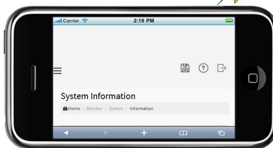
モバイル端末 (iOS または Android)