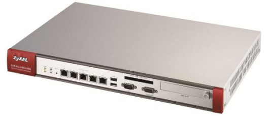
ZyWALL USG 1000