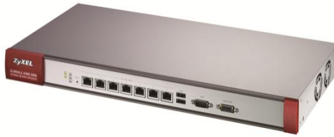
ZyWALL USG 300