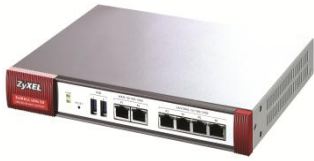
ZyWALL USG 50